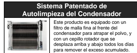
Sistema Patentado de Autolimpieza del Condensador

Este producto es equipado con un filtro de malla fina al frente del condensador para atrapar el polvo, y con un cepillo rotador que se desplaza arriba y abajo todos los días para remover el exceso acumulado.