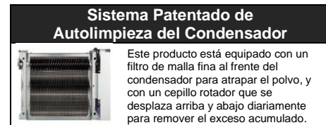
Sistema Patentado de Autolimpieza del Condensador

Este producto está equipado con un filtro de malla fina al frente del condensador para atrapar el polvo, y con un cepillo rotador que se desplaza arriba y abajo diariamente para remover el exceso acumulado.